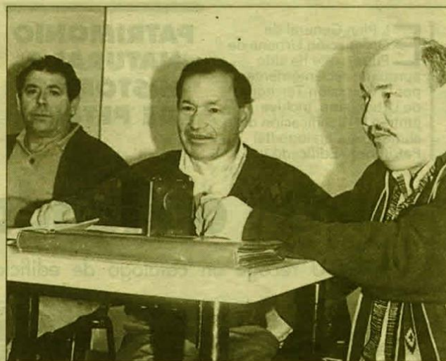
Imagen de la última asamblea de la Asociación de Minusválidos Físicos de Elda

El responsable de esta asociación afirmó que una de sus principales preocupaciones en este momento es lograr que los nuevos edificios que se construyen en la actualidad, no tengan estas barreras arquitectónicas que dificultan la vida normal a los minusválidos.